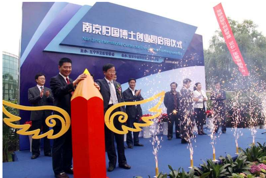
5月18日，南京归国博士创业园正式启用，南京市副市长李琦等领导出席祝贺