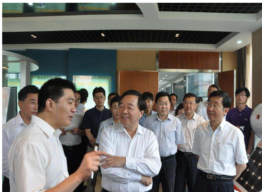
市长季建业、副市长赵晓江、李琦等领导利用周末考察创业园，与留学生亲切交谈。

更加突出的战略位置，把人才规划与科技创新、产业规划对接起来，把优化人才结构和优化产业结构统一起来，把人才政策、科技政策、产业政策协调起来。坚持招才引智和招商引资并举，以创新体系和创新平台建设集聚人才，以推进新兴产业、现代服务业发展，推进千企升级战略实施、推进南京城市功能提升来集聚人才，真正使人才资源转化为产业发展优势，成为南京新增长极的引擎。