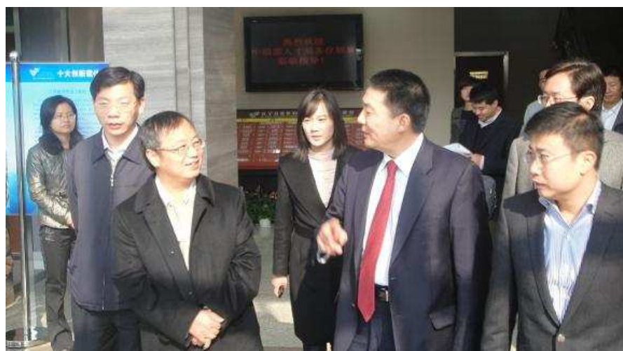
中组部人才局宋局长兴致勃勃的与海归博士交谈在南京创业的经验