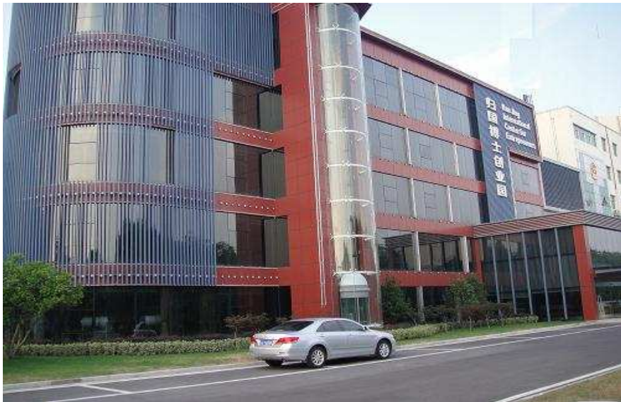
坐落在江宁开发区的南京归国博士创业园大厦

本期责任编辑：吕建彪，025-6660-2923，邮箱：1jb709396419@163.com