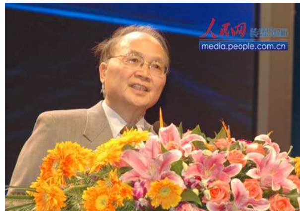
著名美籍华裔物理学家聂华桐在发言