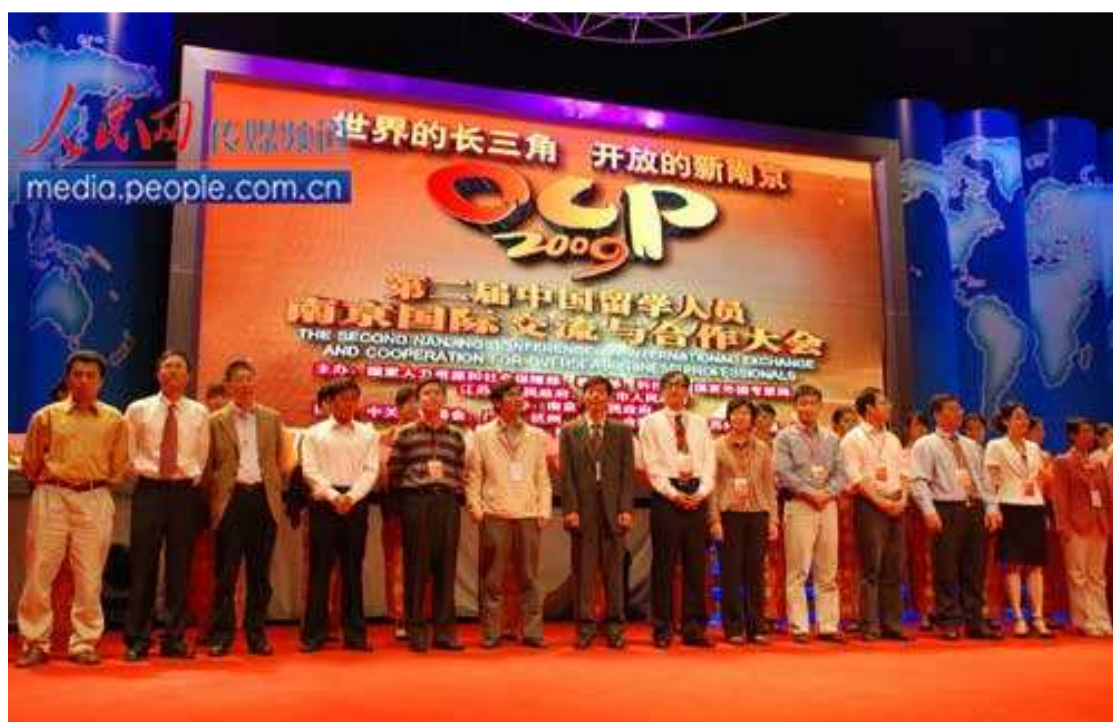
留学人员领取南京蓝卡

在 OCP3，您将了解到南京及泛长三角区域内经济和社会事业发展的最新动态；了解南京目前在全国最系统、最领先、最大力度的引进海外高层次人才的优惠政策和举措；了解南京推进重点支持产业及新兴产业的发展趋势和紧缺技术需求。