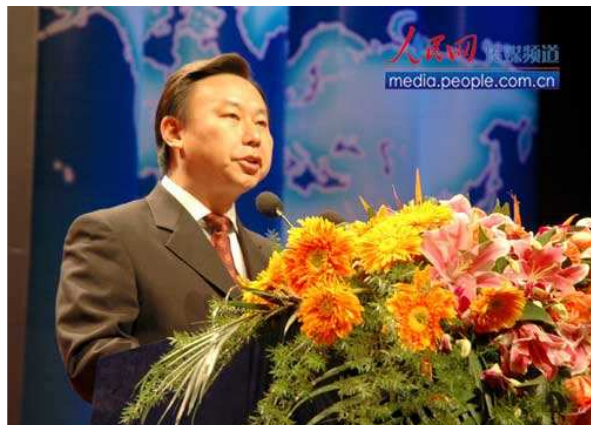
南京常务副市长沈健在大会上致辞