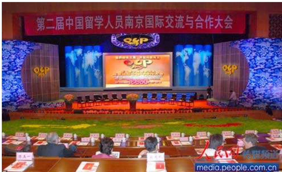
2009年10月28日，第二届中国留学人员南京国际交流与合作大会 OCP2 准备现场

比往年将更进一步。如果您是海外学子留学归来，如果您想完美展示自己的才华，如果您有创业梦想，如果您也想像南京归国博士创业园这样的成功，那请加入我们，我们将与您共同探讨，为更多的海外归国学者建立一个又一个的创业园。我们等着您的到来。