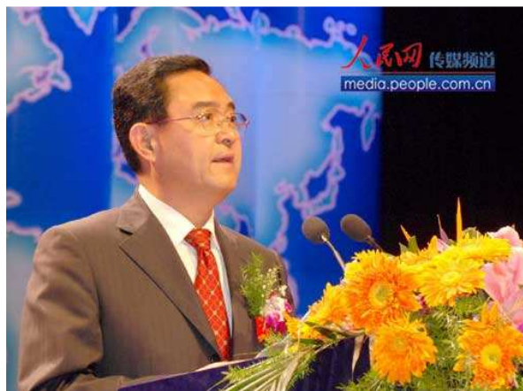
国家外国专家局长季允石在第二届大会上发言

本次大会会期两天，届时，将在南京国际博览中心举办开幕式、项目展示推介、专题沙龙、研讨会、创业融资辅导对接会，以及项目对接活动等等。