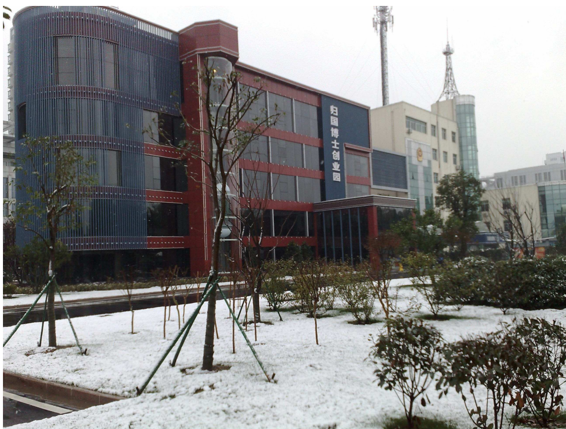
2009年12月的第一场雪，南京归国博士创业园大厦白里透红，一枝独秀。