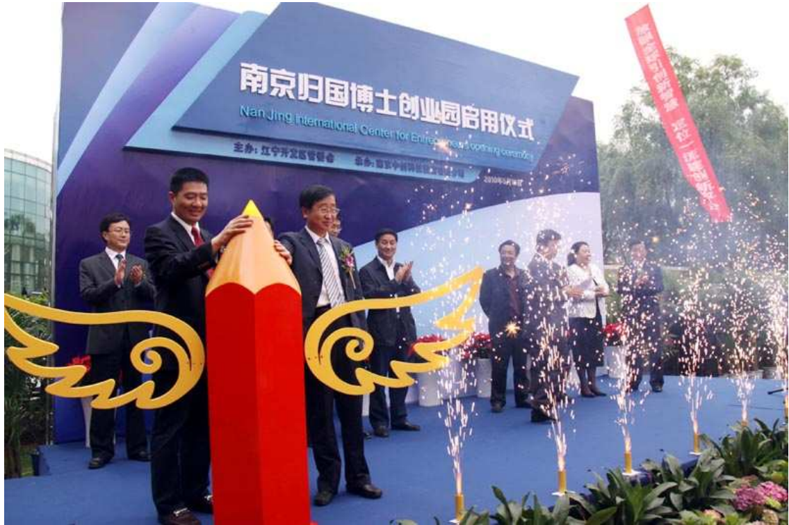
5月18日，南京归国博士创业园正式启用，南京市副市长兼江宁区委书记李琦等领导出席祝贺。