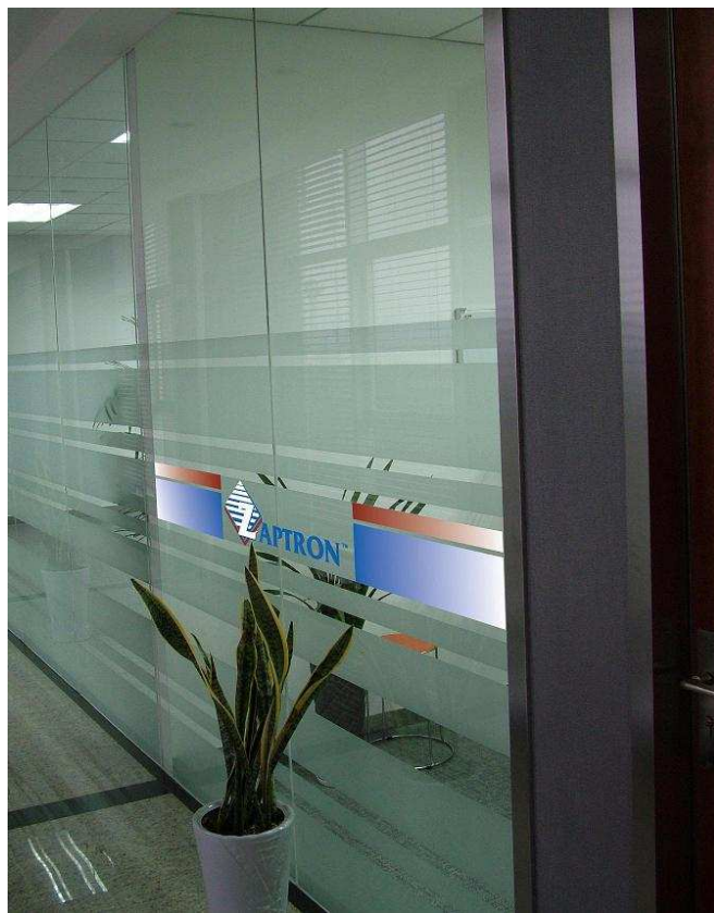
南京艾普创软件有限公司办公区（二楼）